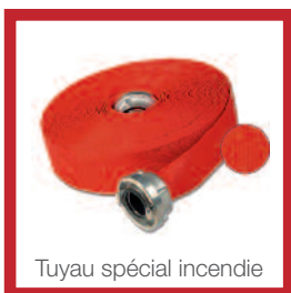
Tuyau spécial incendie