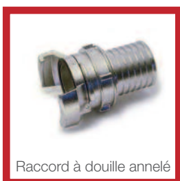
Raccord à douille annelé